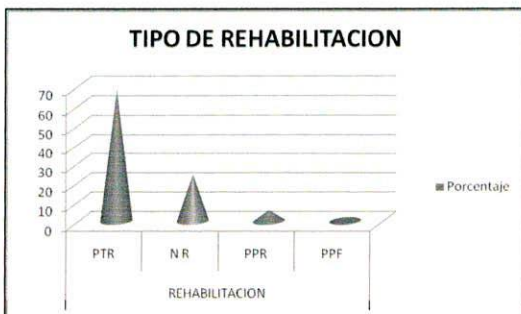
GRAFICA 2: porcentaje del tipo de Rehabilitación protodóntica

PTR: PROSTODONCIA TOTAL REMOVIBLE PPR: PROSTODONCIA PARCIAL REMOVIBLE PPF: PROSTODONCIA PARCIAL FIJA NR: NO SE REHABILITO.