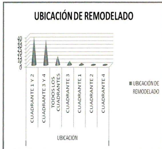
GRAFICA 3: porcentaje de la ubicación del remodelado óseo

Con respecto al tipo de imagen radiográfica utilizada como ayuda diagnóstica para el procedimiento quirúrgico, la radiografía extraoral panorámica fue la más solicitada con un 67.1% y sólo en un 34% se solicitó radiografía periapical. (Tabla 3)