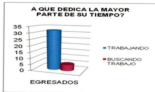
Figura No. 2. Dedicación de tiempo de los egresados

De los egresados que laboran, el 51,7% son empleados de una empresa familiar sin remuneración, el 31% son empleados de una empresa particular y el 17,2% son empleados del gobierno (Figura No. 3.)