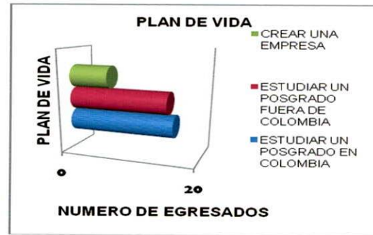
Figura No. 1 Plan de vida de los egresados

En el análisis de la situación laboral actual de los egresados, el 86,5% dedica la mayor parte de su tiempo a trabajar y un 13,5% están buscando empleo (Figura No. 2)