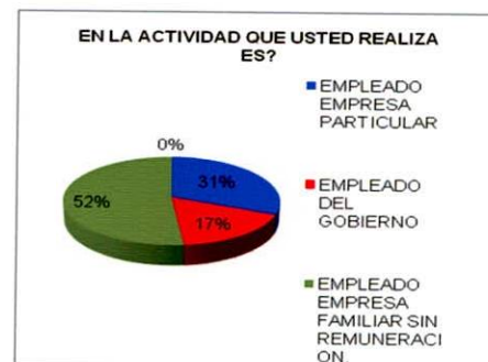
Figura No.3. Actividad laboral del egresado

De los egresados que laboran, el 51,7% son empleados de una empresa familiar sin remuneración, el 31% son empleados de una empresa particular y el 17,2% son empleados del gobierno (Figura No. 3.)