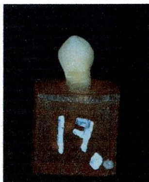
Figura 1: diente sumergido en los cubos de acrílico de 20mm por 20mm.

De los dientes se tomó la superficie vestibular. A la cual se le realizó un tratamiento de la superficie radicular basado en raspaje y alisado radicular de la longitud de la superficie con el fin de eliminar restos del ligamento periodontal y con un disco de carburo se realizaron muescas transversales en dicha superficie para de aumentar la retención dentro de los cubos de acrílico. Se diseñó una formaleta de caucho con las medidas específicas de 20 por 20mm (Figura 1), para luego ensamblar los cubos de acrílico con los dientes situados en una base metálica, que sirvió como base de anclaje de los especímenes para realizar las pruebas en el Instron (Figura 2).