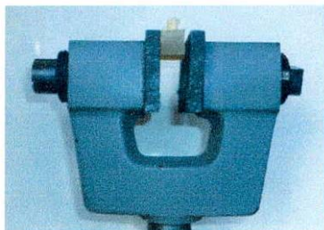
Figura 2: base metálica para soporte de cubos acrílicos de 20mm por 20mm.