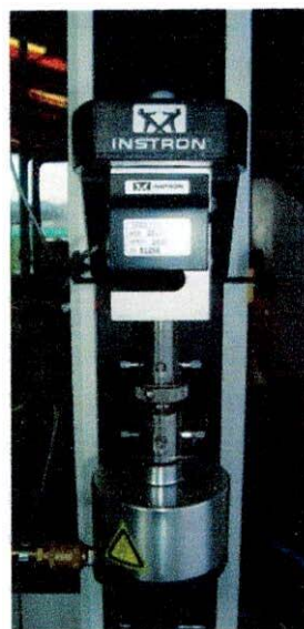
Figura 3. Instron. instrumento universal de datos.

Este instrumento mide fuerza sobre tiempo a una velocidad de 1.5mm/min.