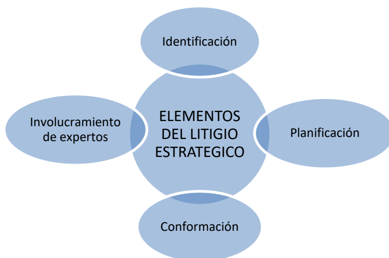
Figura 2 Elementos del litigio estratégico

Rodearse de expertos en el tema, que abarque la esfera multifacética del caso. En casos de trata de personas, es fundamental el involucramiento de la sociedad ya que es necesario el entendimiento de la experiencia, y de todo el sistema jurídico, político, social para la realización de las acciones y planteamiento de las estrategias.