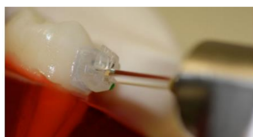
Imágenes de aplicación del láser (4)

Registros que cumplen criterios de inclusión (n= 6)