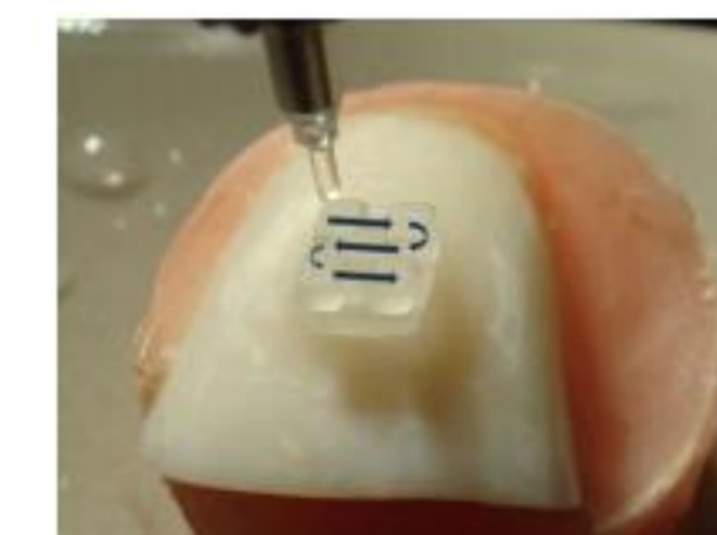
Imagen del método de escaneo (6)