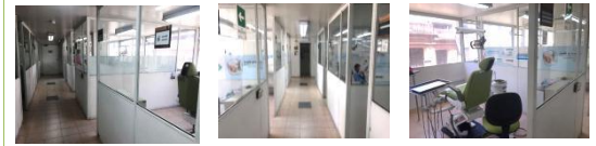
Clínicas de Postgrado de Periodoncia sede Centro, Bogotá