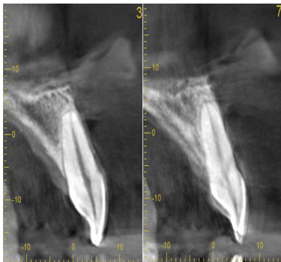
Figura 3. Mujer, con RRE tipo 2 en incisivo central inferior izquierdo.