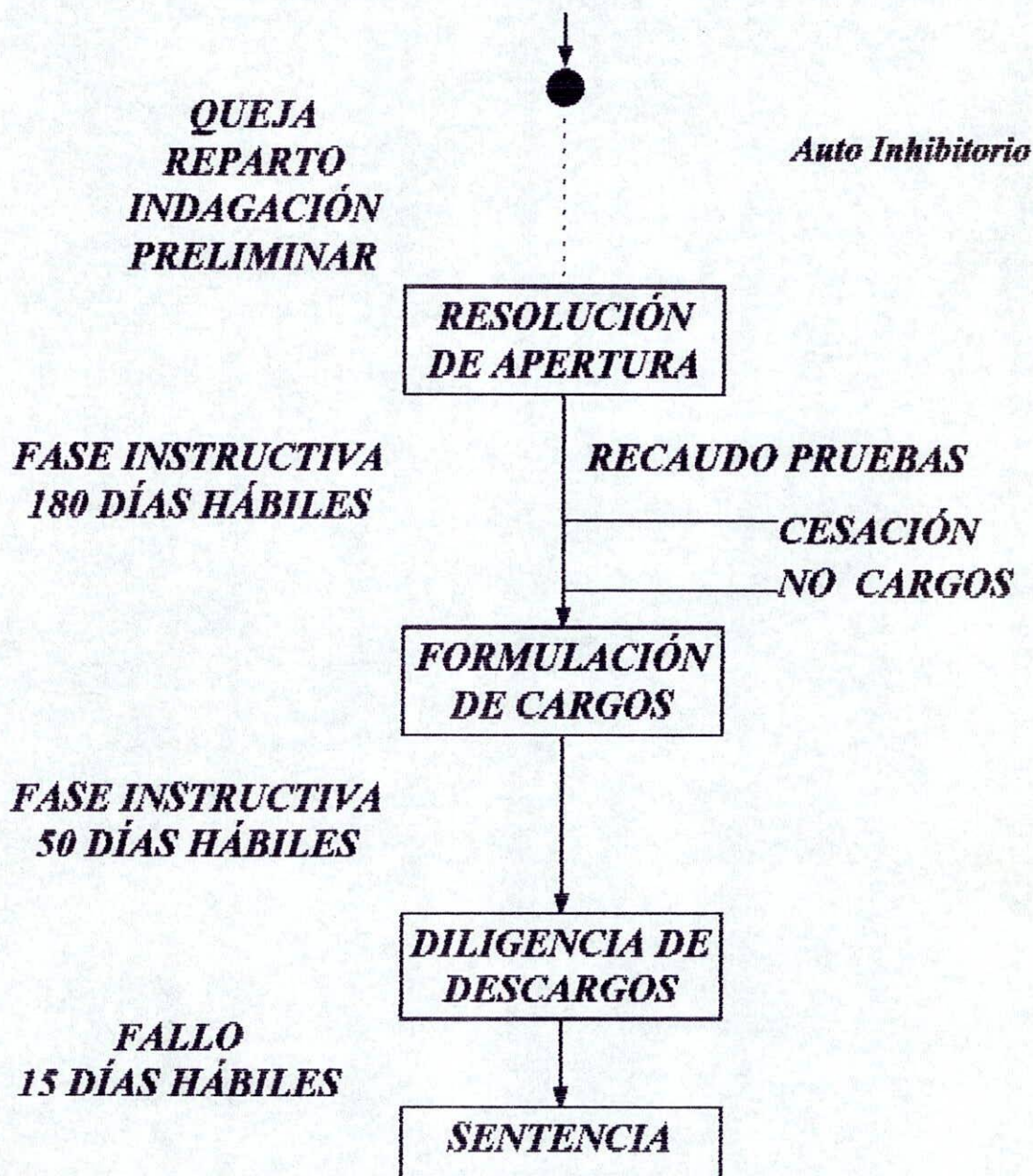
Figura No. 1