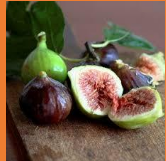
Figura 1. Higos