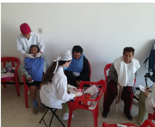
Figura 3. Atención de los adultos mayores del Hogar del Anciano - Centro Día