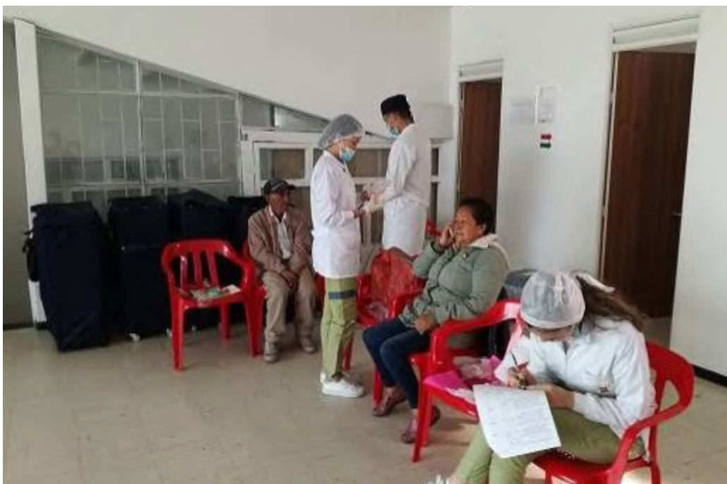
Figura 3. Estudiantes de UNICOC - Colegio Odontológico adelantando actividades de registro de información en la Historia Clínica.

De los 168 pacientes que fueron caracterizados, en las siete fases completadas del Programa “Recuperando mis Mayores Sonrisas”, que se han desarrollado desde el