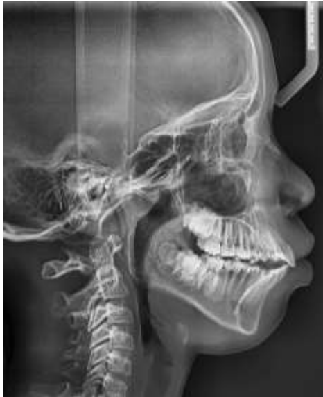
Radiografía lateral – Paciente Masculino, 9 años, afrodescendiente Villa Rica Cauca

Se carece de una base de datos de grupos poblacionales específicos.