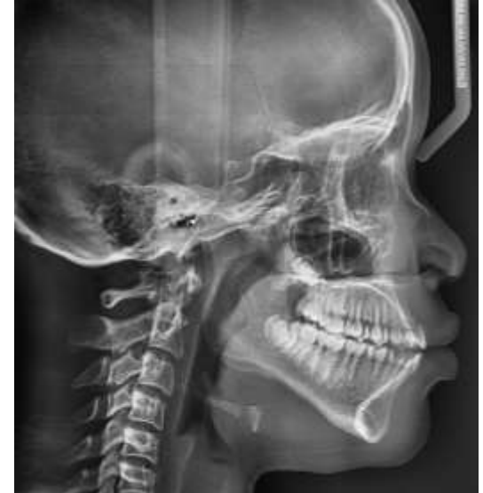
Radiografía Lateral - Paciente Femenina de 10 años, afrodescendiente de Villa Rica Cauca

No se adaptan a las variaciones de la población.